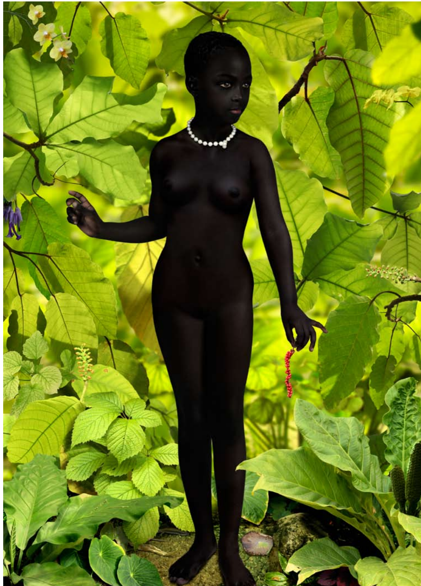
Venus #1 © Ruud van Empel, 2006, Courtesy Flatland Gallery, Utrecht