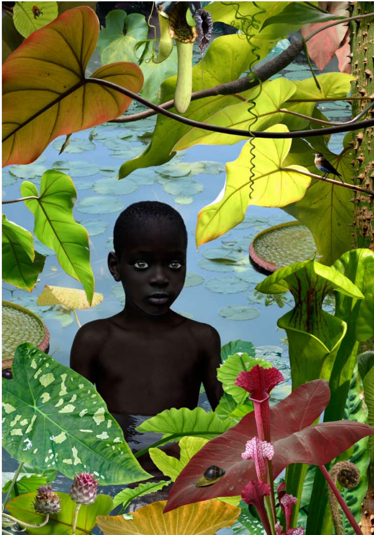
World Eg © Ruud van Empel, 2005, Courtesy Flatland Gallery, Utrecht