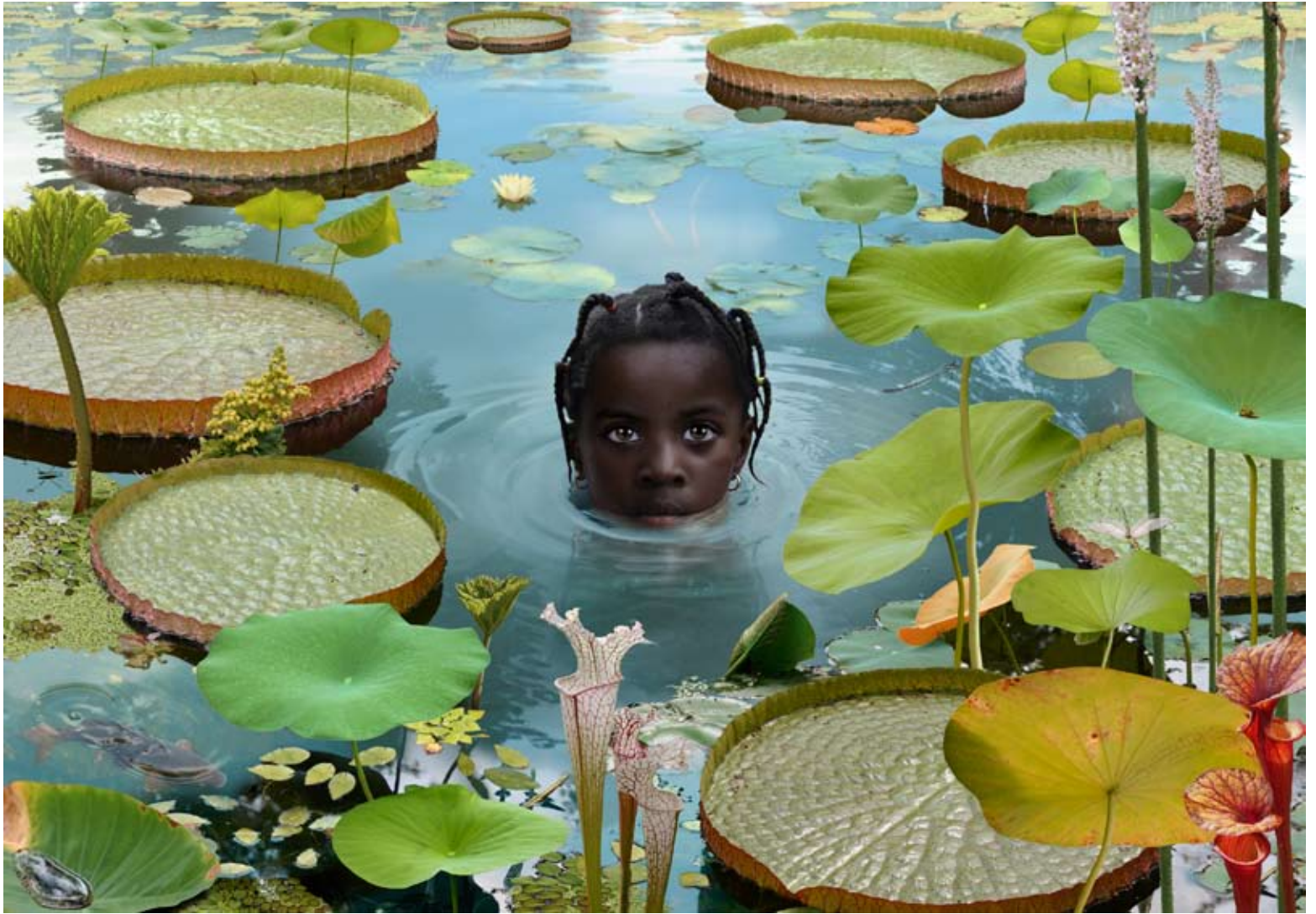
'World #7', 2005 © Ruud van Empel, Cibachrome 105 x 150 cm, Courtesy: Flatland Gallery, Utrecht