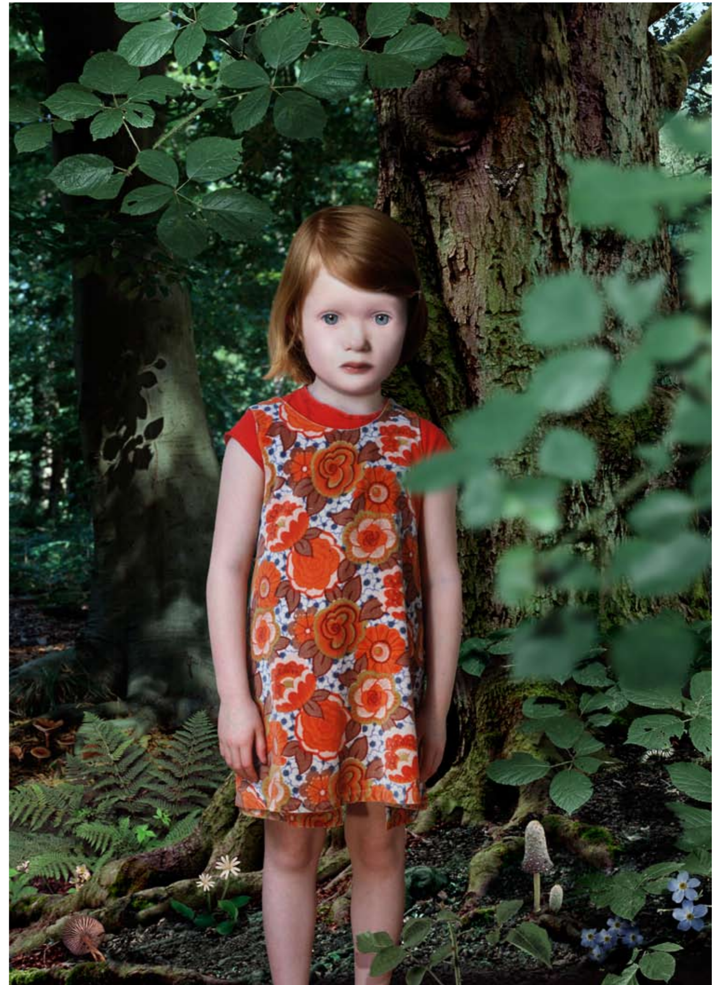
Study in Green #4 © Ruud van Empel, 2003, Courtesy Flatland Gallery, Utrecht