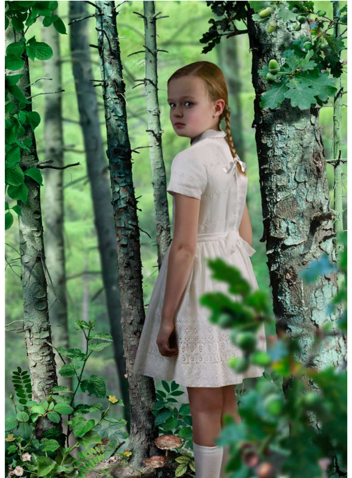
Untitled #2 © Ruud van Empel, 2004, Courtesy Flatland Gallery, Utrecht