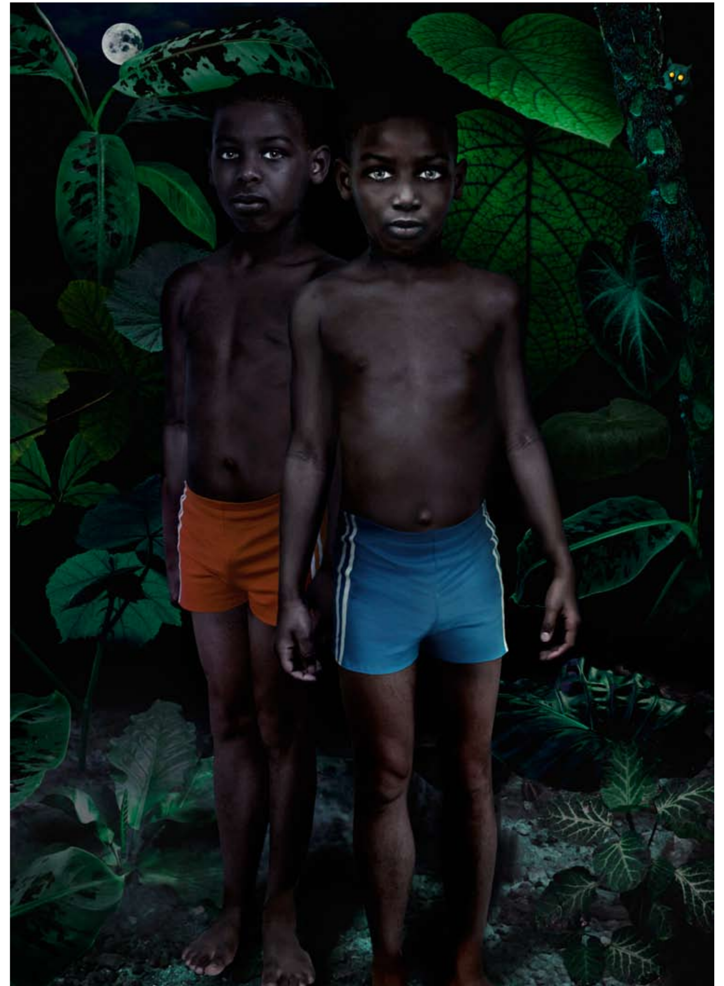
Moon #2 © Ruud van Empel, 2005, Courtesy Flatland Gallery, Utrecht